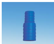
Entlüftungsstutzen / vent connection C1.0605.01