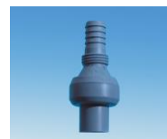
Rückschlagventil mit Entlüftung / non-return-valve with venting 3004.53.00